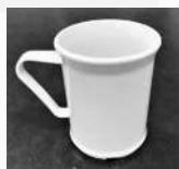
200 mL tasse en plastique (café/thé)