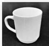
225 mL tasse en verre (café/thé)