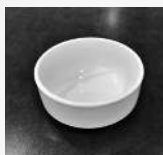
225 mL bol de soupe ou de céréales