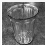
150 mL verre d'eau (pour la prise de médicaments)