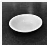
70 mL petit bol (pudding etc.)

Pour obtenir des directives et des conseils supplémentaires :