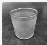
175 mL verre d'eau