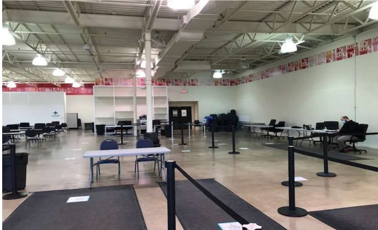
Image reproduite avec l'aimable autorisation de l'organisme de santé publique Alberta Health Services, zone d'Edmonton