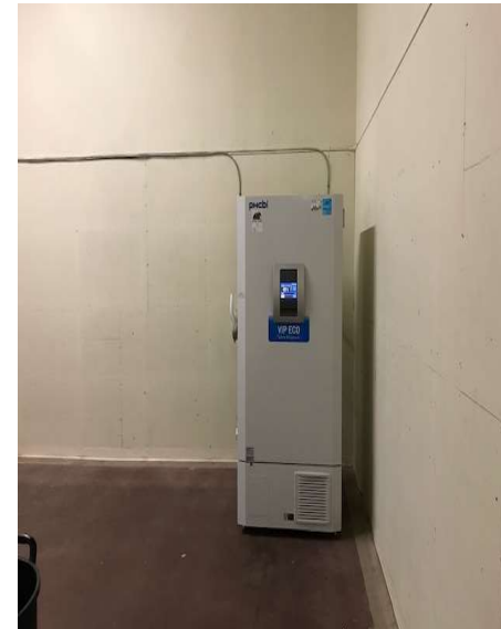
Congélateur à très basse température