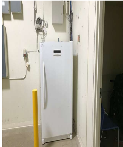
Congélateur pour les blocs réfrigérants